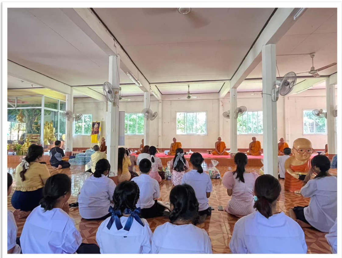
มาตรการส่งเสริมคุณธรรม และความโปร่งใสภายในหน่วยงาน ประจำปีงบประมาณ ๒๕๖๖