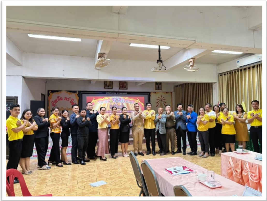
มาตรการส่งเสริมคุณธรรม และความโปร่งใสภายในหน่วยงาน ประจำปีงบประมาณ ๒๕๖๖